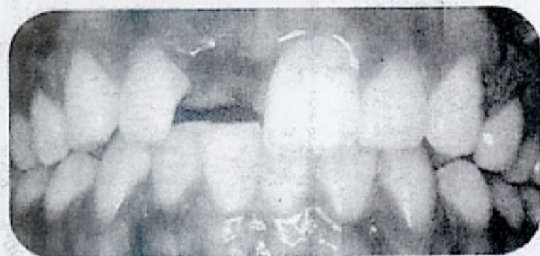
Antes de la sustitución del diente